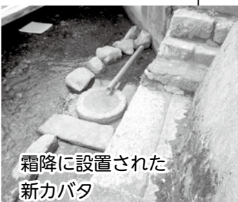
霜降に設置された新カバタ