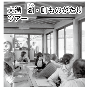
大溝湖・町ものがたりツアー