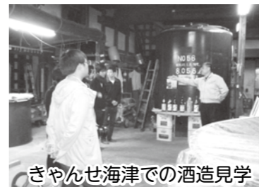
きやんせ海津での酒造見学

11月3日(木)に地域見学イベント「きやんせ海津」を開催しました。当日は協議会会員の案内で昔ながらの町並みの見学や船に乗って琵琶湖上から湖岸の石積みを見学するツアー等を行い、多くの見学者に港町、宿場町として栄えた海津の魅力を紹介することができました。