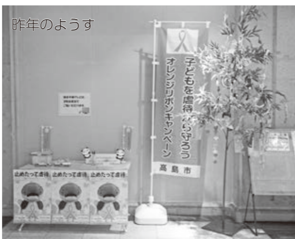
閩子ども家庭相談課 ☎ (25) 8517

期間中、市役所本館東玄関に、オレンジリボンキャンペーンコーナーを設置します。このコーナーでは、子どもの成長や幸せを願い、七夕笹飾りや千羽鶴を作成しています。来庁の際は、ぜひご協力をお願いします。