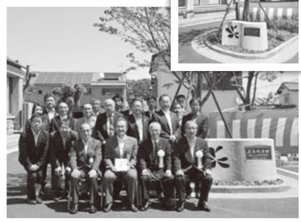
寄贈いただいた桜の木の前で記念撮影