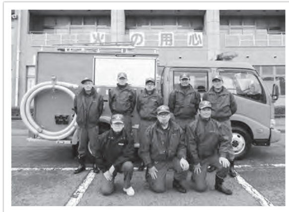
マキノ第1分団(海津)