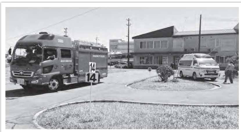
操縦訓練のようす