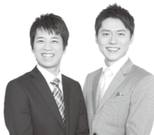
ファミリーレストラン

また、午後からはマキノ駅前で開催される「マキノ駅前がこうなったらいいなあ市」で特産品やクラフトを販売する軽トラ市を盛り上げる予定です。市民の皆さんもぜひ栗マラソンの応援と特産品などの軽トラ市にお越しください。