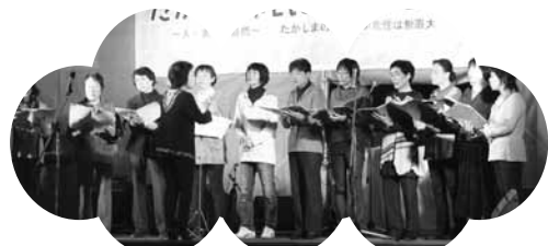
昨年のステージイベント