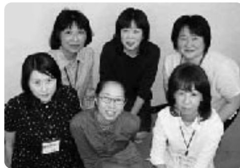
南部グループ: 安曇川、朽木、高島を担当します。