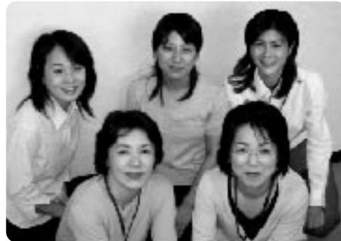
北部グループ: マキノ、今津、新旭を担当します。