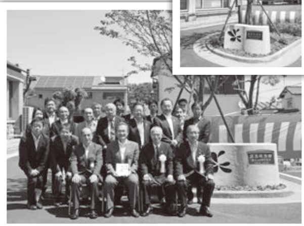
寄贈いただいた桜の木の前で記念撮影