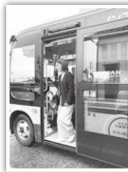
乗り降りしやすいノンステップバス