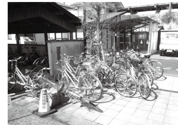
駐輪場外に停められた自転車（新旭駅東駐輪場）

皆さんは、きれいに駐輪場を利用していますか？ 市では市内のJR各駅前に自転車駐輪場を設置していますが、駐輪場以外の歩道などに停められている自転車が目立っています。これは駐輪場の自転車が雑然と停められ、他の自転車が停めにくくなってしまっているの要因です。駐輪場内に自転車をきれいに並べ、スペースが生まれ、より多くの自転車を停めることができます。また、自転車をきれいに並べておくと、後から利用する人も気持ちよく利用できます。一人ひとりがマナーを守り気持ちよく駐輪場を利用しましょう。