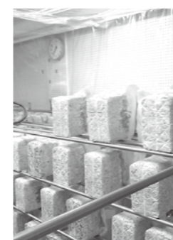
現在、教室には菌床が並べられています