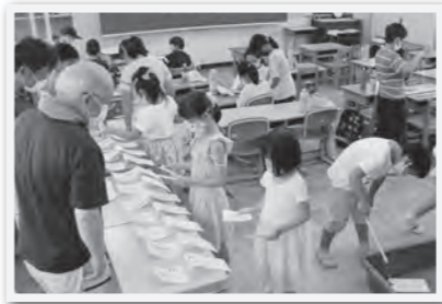
ごみ分別学習のようす

☎ つながろう今津 (今津東コミュニティセンター内) ☎ 090 (4927) 3222