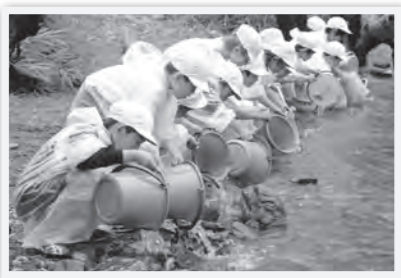
稚鮎の放流のようす