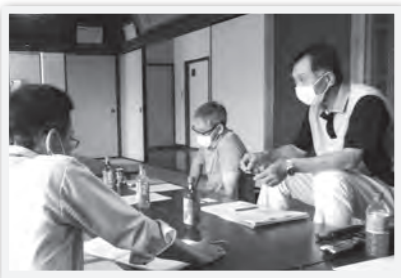
区長・自治会長訪問のようす

☎ 安曇川地域住民自治協議会 (安曇川公民館2階) ☎ 080 (2572) 3739