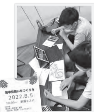
暑中見舞いづくりのようす