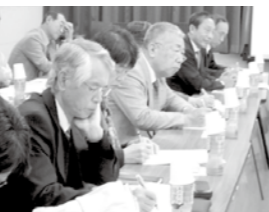
←先進地での取り組みを熱心に学ぶ人権擁護委員

相談は無料で予約は不要、秘密は厳守されます。皆さんの一番身近な相談相手として、お気軽にご相談ください。