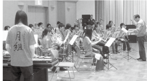
「月組」の皆さんの演奏