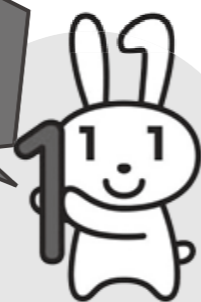
愛称：マイナちゃん

今年の10月からマイナンバーが通知されます。一生使うものですので大切にしてください。