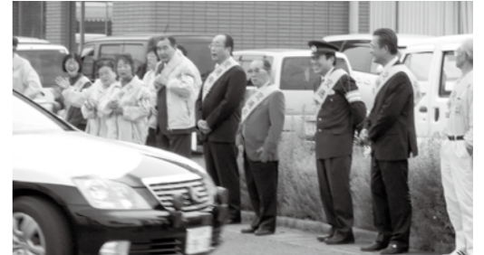
啓発に向かうパトロール車を見送る参加者

春の全国交通安全運動が5月11日(月)から20日(水)まで展開され、市内では交通安全を願って、5月9日(土)安曇川公民館で「春の全国交通安全運動出発式」が開催されました。当日は、市内交通安全関係団体が安全意識の啓発に向けて氣勢をあげました。また、市内で活動されている「高島吹奏楽倶楽部 月組」の皆さんにも参加していただきました。素敵な演奏を披露していただいた後、交通安全宣言を行い、参加者みんなが事故のない高島市を願いました。 その後、市内パトロールに出発するバス・タクシーなどの車両を見送りました。交通安全ゼロを目指して、これからも交通ルールやマナーを守りましょう。 ☎(22) 0058 交通安全推進協議会(事務局 交通対策課)