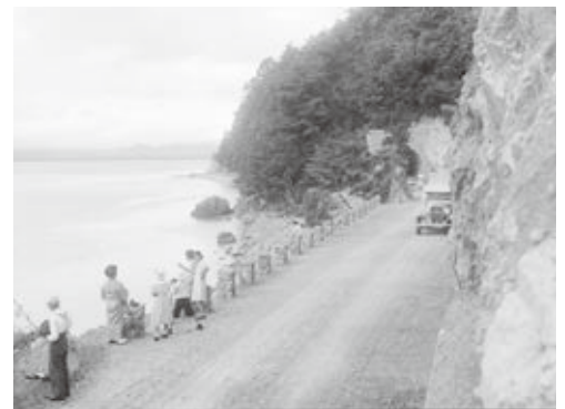
大崎隧道（開通当時のようす）

もあって難所が多く危険な道とされていた海津大崎ルートにトンネルを掘って道路を建設しようとする動きが起こります。昭和10（1935）年1月から工事が始まり昭和11（1936）年6月に5つのトンネルが完成しました。大崎トンネルが開通したことによって、これまで通行することのなかった自動車やバスが通るようになり、湖周道路としての利便性は飛躍的に向上しました。この道は昭和62年（1987）に奥琵琶トンネルが開通するまでは国道303号として湖北と高島を結ぶ主要道でした。