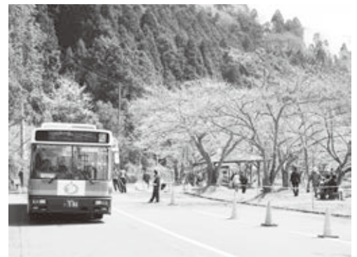
海津大崎の桜（平成31年のようす）

者の手によって植えられた桜は、今では湖岸に沿って美しい桜並木が続く「海津大崎の桜」として知られ、高島を代表する観光名所の一つとなっています。