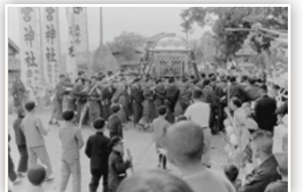
深溝の日吉二宮神社の祭りだと思えます。年代・場所は不明。