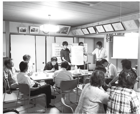
集落座談会のようす

人口減少と高齢化の進展により、地域活動の維持が困難になっているなどの集落の課題をお聞きするとともに、未来の集落のあり方を住民の皆さん自身で考えていただく機会として、市では平成27年度から「集落座談会」を開催し、平成27年度に2地区、平成28年度