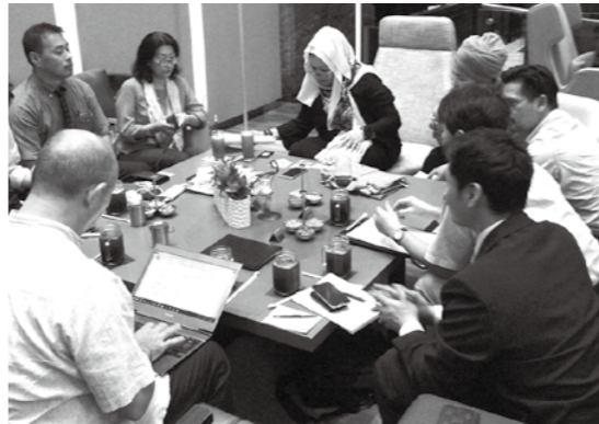
現地デザイナーとの商談の様子

全国シェアの90%を市内で生産している綿クレープ「高島ちぢみ」の国内市場が縮小する中、吸湿性にすぐれ、さわやかな着心地が得られる特性を生かし、高温多湿の東南アジア諸国に向けた販路開拓調査を実施してきました。