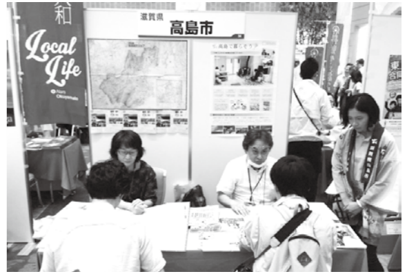
コンシェルジュによる都市圏での移住相談会

し、就職を希望される方に対して、職業相談を実施しているほか、市内の不動産業者と連携して、「空き家紹介システム」を構築することで、仕事と住まいを含めた細やかな移住相談体制を整えています。