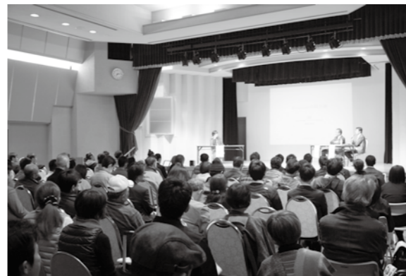
熱気にあふれる会場

11月9日には、こうした活動の報告会として「第7回ディスプレイ高島会議」を開催し、市内外100人を超える方々と一緒に、これからの高島の魅力の発信について考えました。