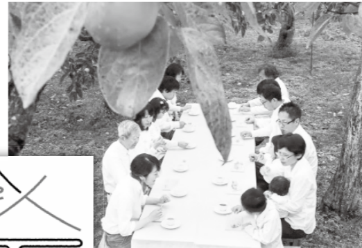
「高島の食と人」第3話「柿の桃源郷」より