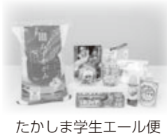
たかしま学生エール便

○コロナ禍において減少した団体客を取り戻すため、引き続き、市内宿泊事業者に対し、団体客の誘致に係る助成を行います。 ○高島市出身で市外にひとり暮らしをしている大学生等を支援するため、お米など市の特産品等を詰め合わせた食糧支援パック「たかしま学生エール便」を届けます。(本誌6ページの特集2をご覧ください。)