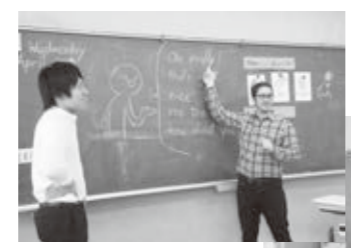
担任とALTとで進める外国語の授業

「研究授業をするにあたって、どのように工夫をするとよい授業になるかをアドバイスしてもらい、とてもよかったです。授業での子どもたちの反応は想像以上で、指導している自分が楽しく感じられました。」