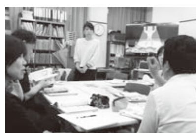
外国語授業研究会