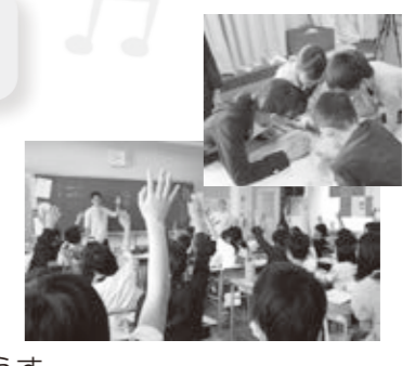
市内小学校の外国語授業のようす