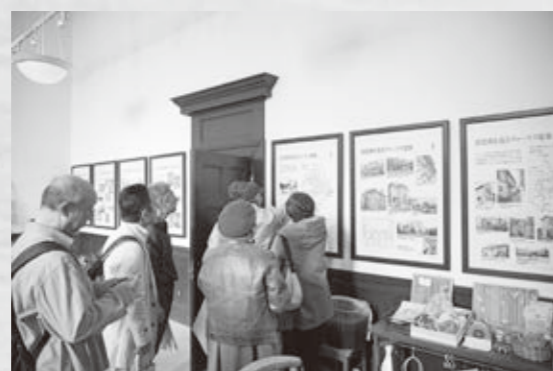
高島ミーティング 近江今津街歩きの様子

○マッチングイベント 「外の力を借りたい」市内の市民団体と、「もっと高島に関わりたい」高島縁人とをつなげるイベントです。この活動を通して、例えばヴォーリス今津郵便局での建物補修イベントに高島縁人の方が参加されたほか、昨年度はオンラインで市内のいくつかの市民活動団体を高島縁人の方に紹介しました。