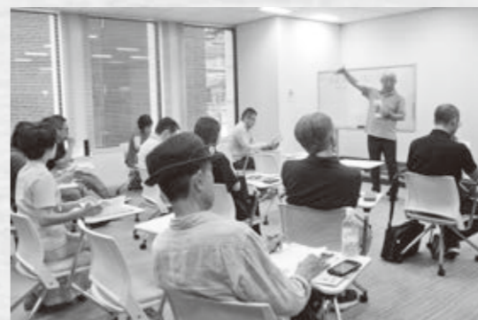
大阪でのプロモーションイベントの様子

■これまでの縁人の活動 ○プロモーションイベント 令和元年度には、東京・大阪など都市圏の方に、高島市と高島縁人の取り組みを紹介するイベントを開催しました。また、高島を知