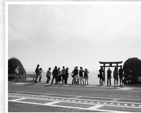
ビワイチのフォトスポット「白鬚神社」

さらに近年では、大阪や京都を 中心に海外観光客が目立ち、宿泊 施設の不足なども課題になってお り、こうした流れに、2020 年の東京オリンピック・パラリン ピック開催などが重なり、「海津・