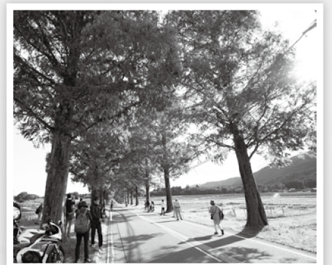
観光客で賑わうメタセコイア並木

か、さらなる企業誘致の推進を図 ることとして、新規立地企業数5 件、新規雇用者数150人という これまでの目標を、それぞれ10件、 600人に上方修正しました。 あわせて総合戦略全体の雇用創 出者目標を、従来の「5年間で 500人」から、「5年間で1, 000人」へと上方修正しました。