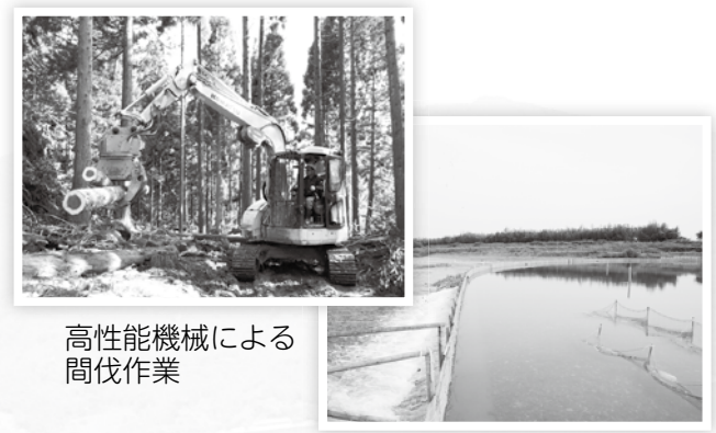
高性能機械による 間伐作業