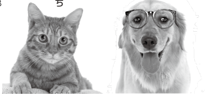
環境政策課 ☎(25) 8123

一部の人の心無い行動で、犬や猫が嫌われてしまいます。正しい飼い方を心がけ人とペットが共に快適に暮らせるようにしましょう。