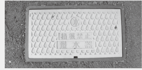
↑メーターボックス