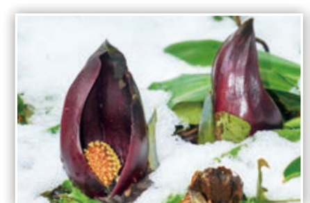
「ザゼンソウ群生地」 自ら発熱して、周囲の雪を溶かすザゼンソウ。雪の中からひょっこり出ているね♪

スマートフォンや携帯電話などからの応募も大歓迎!また、市ホームページではカラーで掲載!