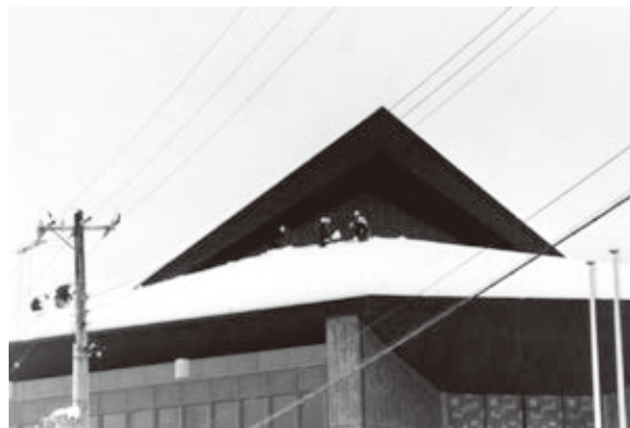
屋根で除雪作業（現：高島市民会館）

今津町では平野部で1・3mの積雪があり、建物の倒壊や農作物への被害が問題となりました。また、保坂地区では五六豪雪の最高積雪量を大きく上回る4mもの積雪を記録し、地域内37戸の民家が雪で完全に埋もれてしまうこととなりしました。降り続ける雪に除雪が追いつかず、住民は玄関前の雪の壁を乗り越えて道へ出て、終日除雪作業に追われたそうです。市では、こうした数々の経験から、除雪車や消雪装置の整備を促