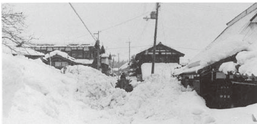
伊井集落内のような

高島市は冬の寒さが厳しく降雪量の多い地域で、積雪が日常生活に大きな支障をもたらすこともあります。今回は昭和50年代に発生した大雪とその被害について、当時の新聞記事や広報誌をもとに今津地域の事例を紹介します。