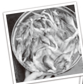
家の庭で採れた たくさんのミョウガ