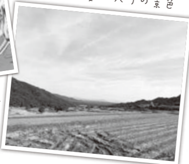
朝の静かな歩で見つけた お気に入りの景色