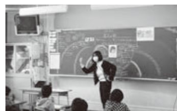
4年生の道徳の授業の様子

児童生徒が、毎時間の授業で扱われる道徳的価値を理解することはもちろんですが、日々の生活を振り返りながら道徳的価値を自覚できるよう、高島学園の教職員全員で「考え、議論する道徳」と授業改善に努めました。