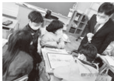
5年生の道徳の授業の様子

「授業中、問題がわからなくて困っている友達に解き方を教えることについて、どう思いますか?なぜそう思うのですか?これは、5年生の道徳の授業「公正・公平」での問いかけです。