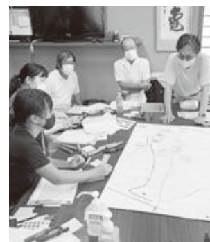
地区の皆さんと協力して防災マップを作成します