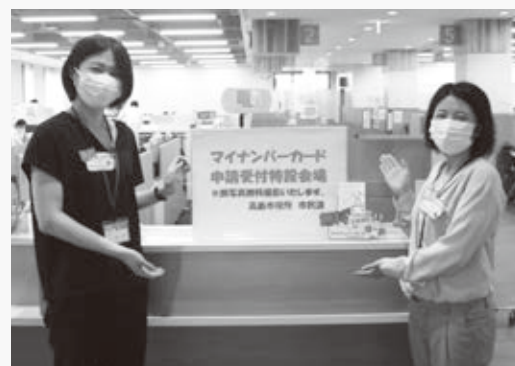
市民課に設置された特設会場