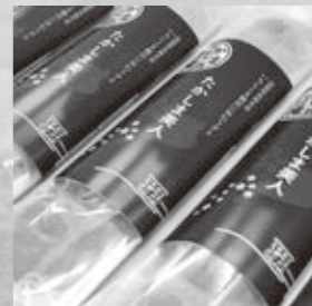
いちじくを味わうグミ「たかしま美人」