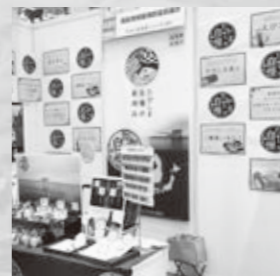
地方銀行フードセレクションブース