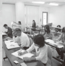
セミナーのようす