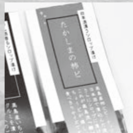
本物の柿を使った「たかしまの柿」