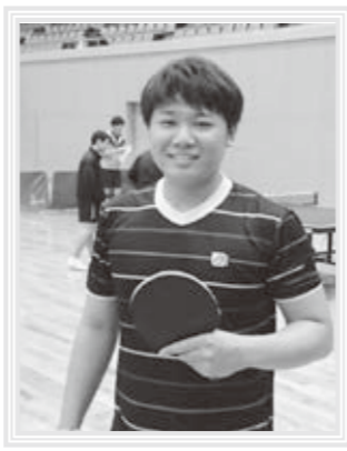
休みの日は卓球でリフレッシュ！

Q 休みの日は？ A 地元で働くことを選んだ理由？ A 地元で働くことが大きいので。今は部屋を借りて、妻と子どもと暮らしていますが、将来的には実家の隣に家を建てたいと思っています。