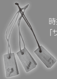
時折奏でる音色が心地良い「サクラ奏でるストラップ」

平成30年度からは、新たに「観光資源」をキーワードに、セミナー開催による人材の育成、雇用の拡大の応援と、高島産品を活用したお土産品の開発に取り組んでいます。