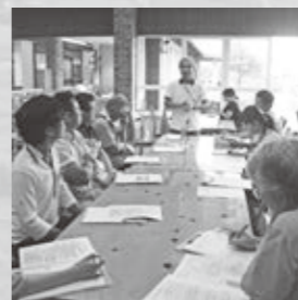
現地研修会のようす