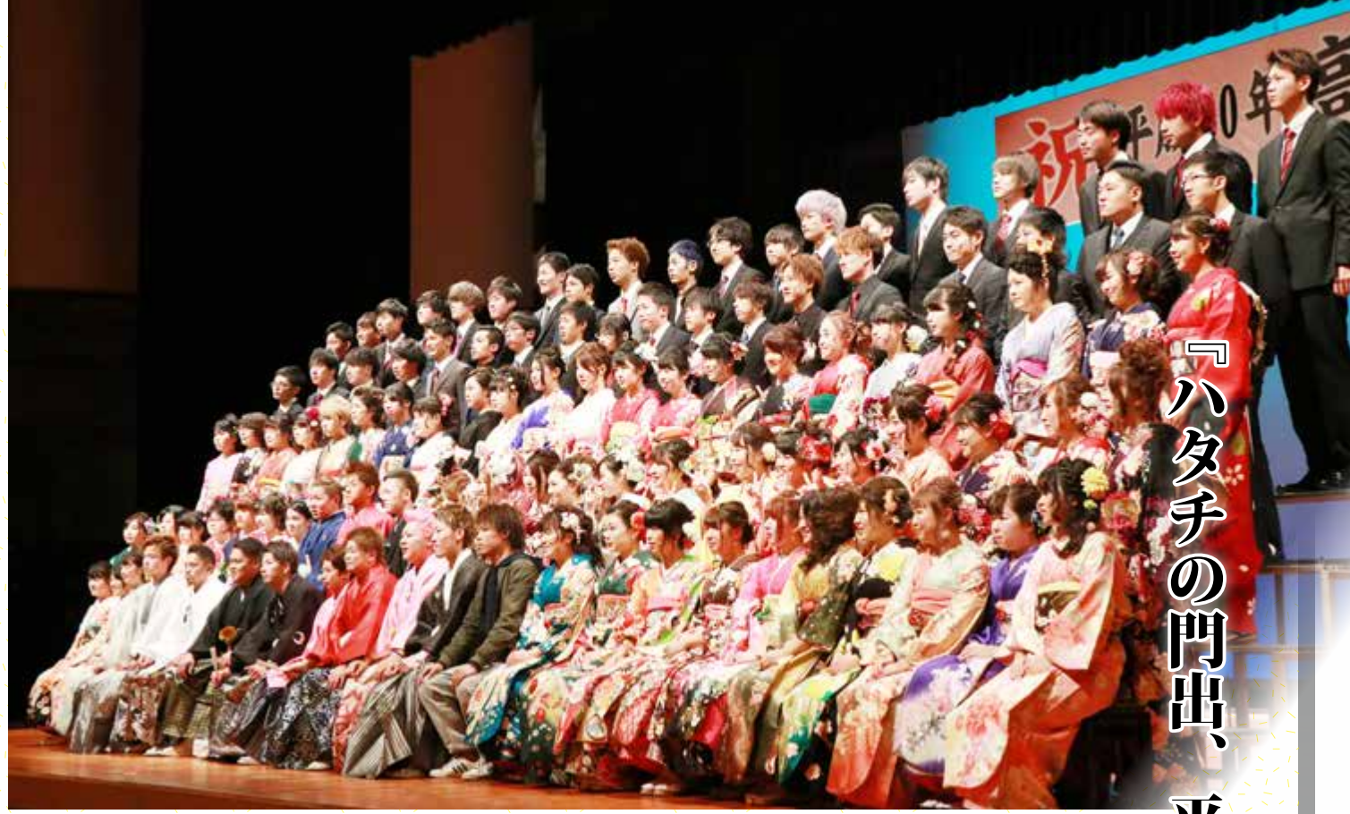
記念写真撮影のようす(安曇川地域)

1月7日(日)に高島市民会館で行われた成人式。407人の初々しい若者が集い、「おとな」としての決意を新たにしました。会場では、晴れ着姿の新成人が同級生や友人との再会を喜び合う光景が随所で見られました。