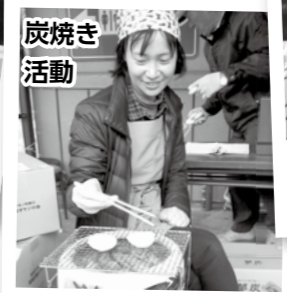
炭焼き活動 集落資源の活用検討