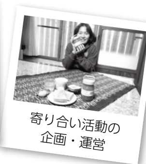
寄り合い活動の企画・運営

集落外にも行く？ 軸足を野口に置いていますが、必要に応じて遠出します。集落の外の活動も多いです。最近では学校関連の活動が多いですね。