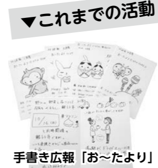
手書き広報「お～たより」 地域の行事や団体の活動を発信 (Facebook等)