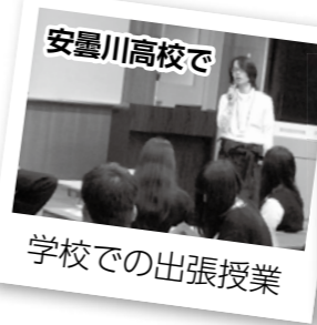
安曇川高校で 学校での出張授業