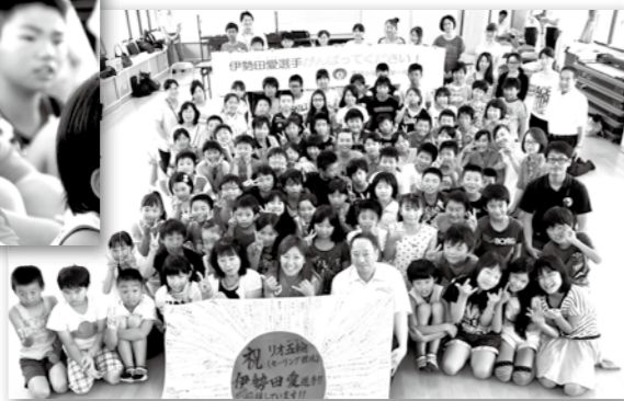
「笑顔で頑張ります!」