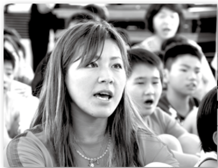
懐かしの校歌斉唱では「自然に口が動きました」

自身の母校でもある青柳小学校を訪れ、子どもたちからの激励に、「みんなの笑顔から力をもらったので、オリンピックでは良い結果をみんなに伝えられるように頑張ります」と話されていました。