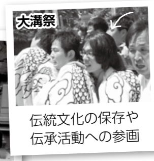
大溝祭 伝統文化の保存や伝承活動への参画