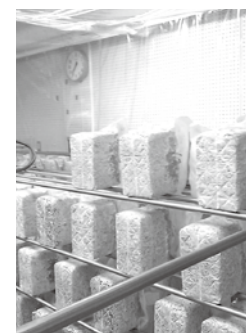
現在、教室には菌床が並べられています

て、旧今津西小学校を利用したいとお話がありました。そうした中、東近江市に本社を置く共栄精密株式会社から、菌茸類菌床の生産事業等の拠点として、旧今津西小学校を利用したいとお話がありました。