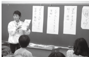
人権擁護委員の活動（市内小学校で人権教室なども行っています。）

相談は無料で予約は不要、秘密は厳守されます。皆さんの一番身近な相談相手として、お気軽にご相談ください。