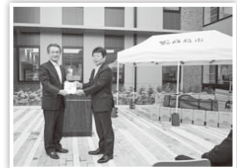
テント10張をご恵贈いただきました