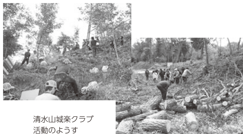
清水山城築クラブ活動のようす

また、保全だけでなく、次世代を担う子どもたちに清水山城館跡を知ってもらうため、地元の小学