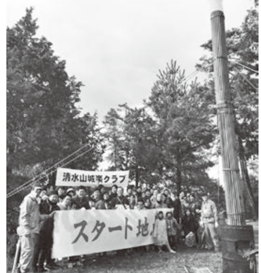
滋賀銀行の地域への感謝活動 (のろし駅伝参加)

べきである。」という熱意のもと、滋賀県の歴史遺産や伝統文化をクールジャパンアワードに推薦されました。その結果、5月10日に「近江湖西の山城と水城」という名称で、戦国時代