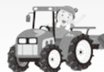
農政策課 (25) 8511