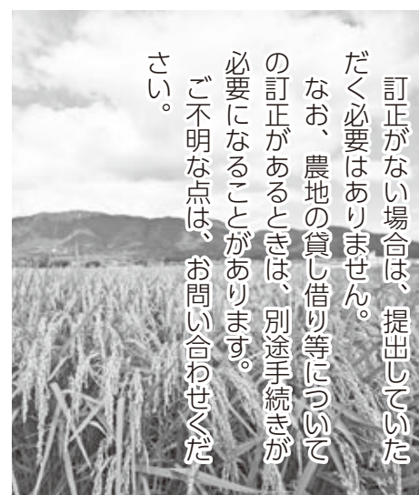
農地基本台帳事務局 (25) 8513

訂正がない場合は、提出していただく必要はありません。なお、農地の貸し借り等についての訂正があるときは、別途手続きが必要になることがあります。ご不明な点は、お問い合わせください。