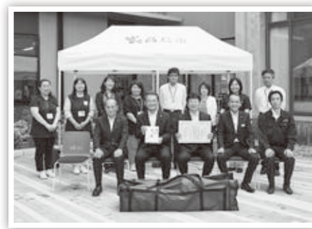
テントの前で記念撮影