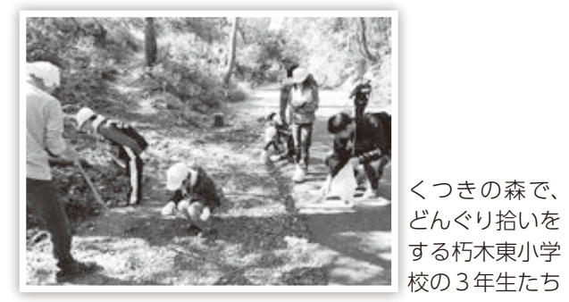
くつきの森で、どんぐり拾いをする朽木東小学校の3年生たち

『どんぐりプロジェクト』は朽木東小学校の生徒たちが、くつきの森に生育するどんぐりから苗木を育て、卒業時に「太陽生命くつきの森林」に植樹するという活動であり、平成23年から継続的に実施しています。地元小学生、地域住民、企業が力を合