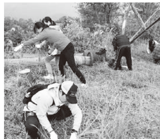
清水山城館跡除草・清掃作業

主催者は、一般社団法人クールジャパン協議会で、日本に埋もれている地域資源（モノ・ヒト・カルチャーなど）を発掘し、外国人審査員100人により評価が行われます。2015年から始まり、2年に1回開催され、今回で3回目を迎えます。これまで全国で44作品が認定されており、2019年は、推薦があった307作品の中から新たに53作品が認定されました。清水山城館跡と大溝城跡もそのうちの一つに名を連ねることになりました。