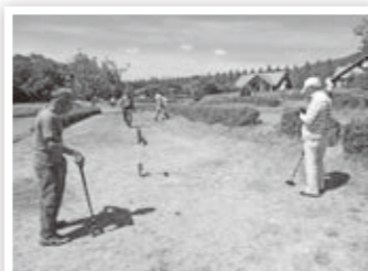
グラウンド・ゴルフ大会