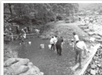
子どもたちとの魚つかみ体験