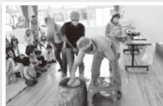
子どもたちとの餅つき大会