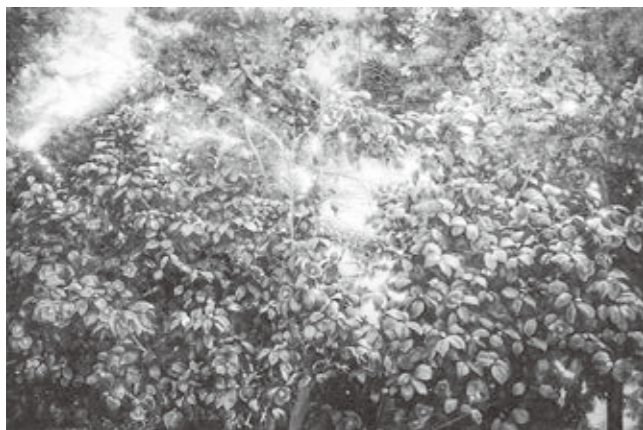
「彼方の庭— 藪椿 —」