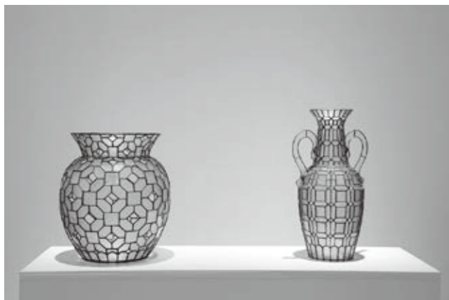
「庭」(左) / 「庭」(右)