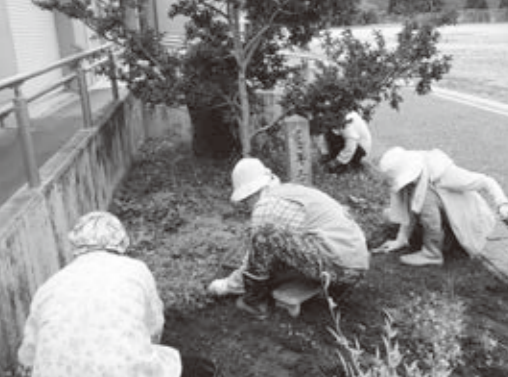
ボランティアへのメール配信で学校からのお知らせがすぐに届きます。 朽木