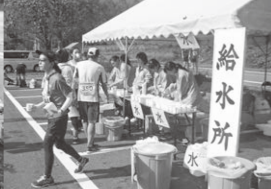
栗マラソンの受付案内や給水所で中学生が活躍してくれました。 マキノ