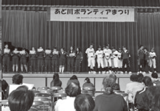
学校を会場に地域ボランティアまつりを開催し、多くの中学生が参加しました。 安曇川