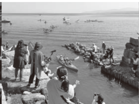
特色ある学校行事を、地域全体で支援しています。 マキノ