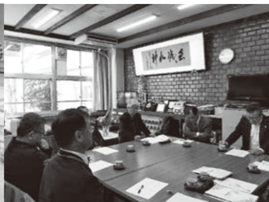
地域の声で、地域学校協働本部設立準備会を開催しました。 今津