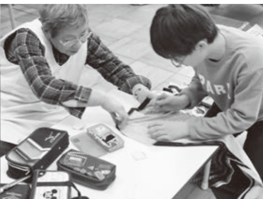
家庭科では、きめ細やかなサポートをしています。 高島