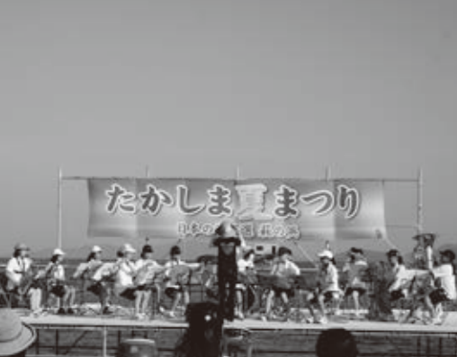
地域のさまざまな行事を中学生の力で盛り上げます。 高島