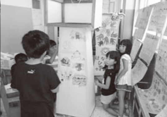
やさし今津の灯ろうを「はなまる広場（学校応援団）」と一緒に作りました。 今津