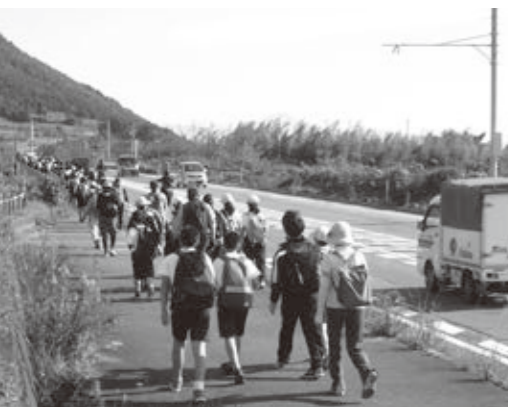
ふるさとウォークでは、コース見守りなど、多くのボランティアに協力いただきました。 新旭