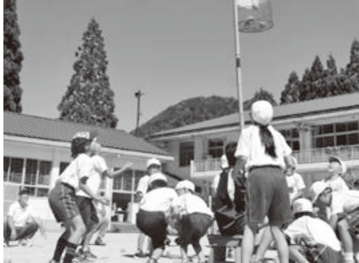
地区と学校の合同運動会には、地域の一人として参加します。 朽木