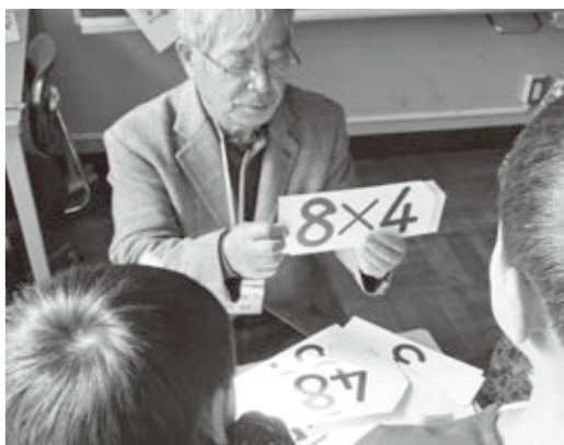
九九道場（暗唱確認）は市内の小学校に広がっています。 新旭