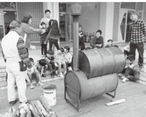
ボランティア団体と学校との連携も進みました。子どもが育てたお芋を焼き芋にしました。 安曇川

高島の未来を担う子どもたちを地域全体で育むため、平成30年度から市内全ての小中学校でスタートした地域学校協働活動はボランティアの皆さんの力によって広がりを見せています。