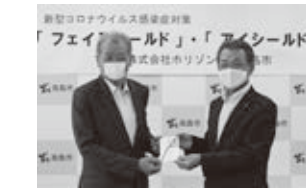
株式会社コア・ビジネス様贈呈式