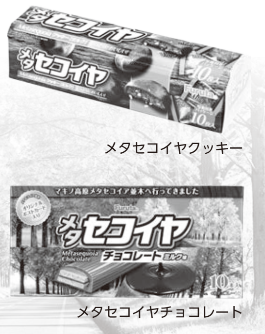
メタセコイヤクッキー