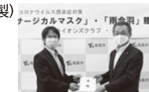
高島ライオンズクラブ様贈呈式