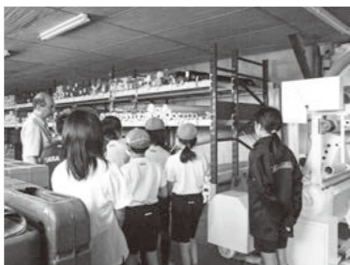
地元の事業所での社会見学

に気付いたり、多くの大人との触れ合いから、多様な生き方や価値観を学んだりしています。 このようにして、子どもたちは、自らの学びのプロセスを記録に残し、9年間の積み上げをしています。そして、学んだことや感じたことをもとに、自分自身の生き方について、大切に考えることができるようになります。 教室で学習していることが、普段の生活や社会につながっていることに気付くような授業を行い、子どもたちの向上心を高めます。これらのことが、子どもたちの学びに向かう力を高め、生きる力を育むことにつながり、将来への「道しるべ」になると考えています。