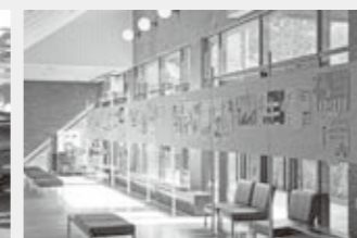
交通安全こどもの“え”作品展