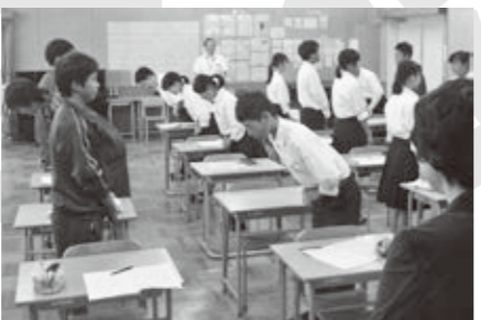
一流のおもてなしを学ぶ

職場体験へ行く前に、高島屋の新人研修担当者によるマナー講座で、一流のおもてなしを学びます。これまでに、市内200以上の事業所でお世話になり、働く意義について考えています。 さまざまな取り組みを通して、自分の役割や生き方・働き方などを考える力を育てています。