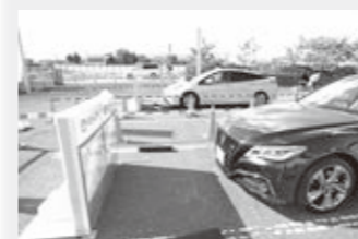
自動ブレーキ体験コーナー