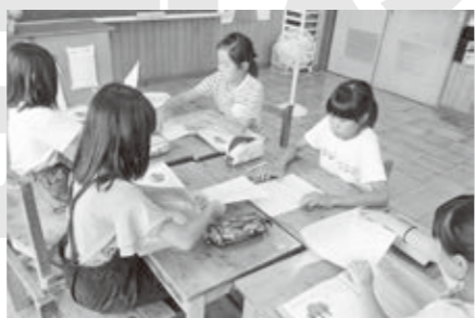
小学校でのキャリア授業

社会見学では、地域の施設や事業所を訪問し、働いておられる方との触れ合いを深めています。異学年交流や縦割り活動では、思いやりやリーダー性を養っています。将来の夢や学びの記録を残し、次の学年に引き継いでいく取り組みも行っています。 新しいことに挑戦し、失敗しても粘り強く取り組む力を育てています。