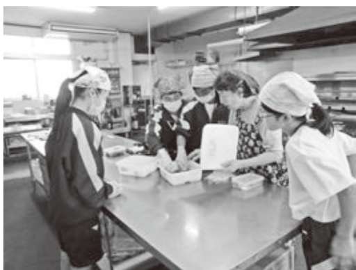
地元の老舗料理屋で職場体験

「Work Life Story Expo」として、市内の多くの職業人と対話する機会もっています。 また、地元の事業所に協力をいただきながら開発した商品を高島屋などで販売しています。 これらの体験を通して、自立して生きていく力を育てています。