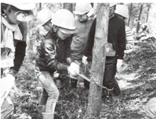
朽木地域で間伐体験