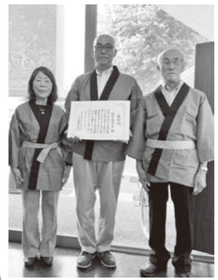
清水山城楽クラブの皆さん