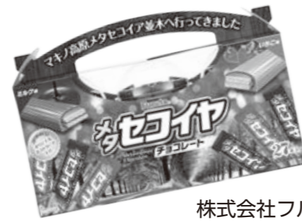
株式会社フルタ製菓の「メタセコイヤチョコレート」