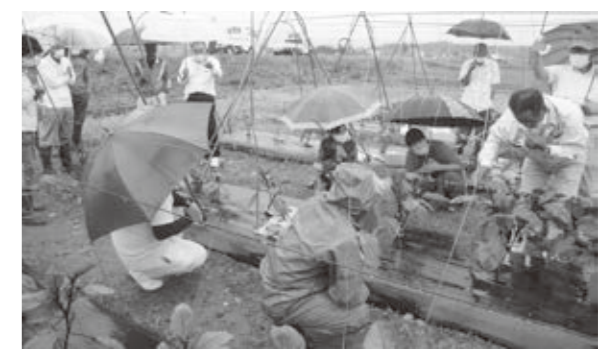
雨の中熱心に説明を受ける受講生