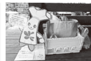
市役所では随時受付しています

食品ロス削減プロジェクトは、主に個人と事業所向けへのフードドライブを推進していきます。家庭からは、買わずして消費できないものや贈答品で余ってしまったものを集め、事業者からは、規格外の食品や消費期限が迫ることで廃棄になってしまうものを寄付け