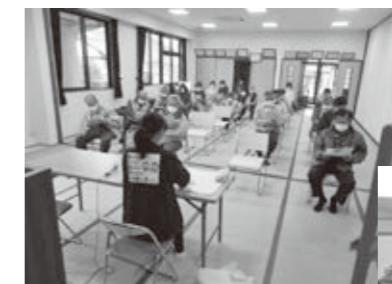
市民団体の普段の活動の様子