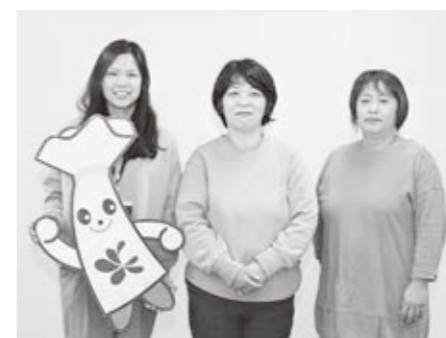
事業を実施するメンバー

▼事業者 フードバンクびわ湖たかしま ▼担当課 環境政策課 ▼事業目的 本来食べることができてもかわらず捨てられている食品を削減することで、環境負荷の軽減を図ります。