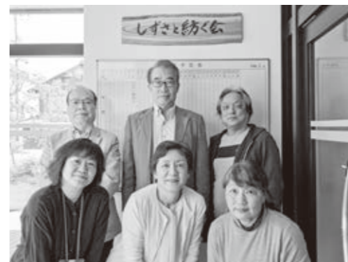
事業を実施するメンバー

▼事業者 しずさと紡ぐ会 ▼担当課 市民協働課 ▼事業目的 市民同士の助け合いによる活動を通して、市民による主体的なまちづくりと顔の見える関係づくりの仕組みを再構築します。