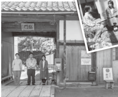
事業を実施するメンバー

▼事業者 大溝の水辺景観まちづくり協議会 ▼担当課 市民協働課定住推進室 ▼事業目的 「観光」から「移住」までをフォローする体制を整備することで、よりスムーズで安心な移住定住の拡大を目指します。