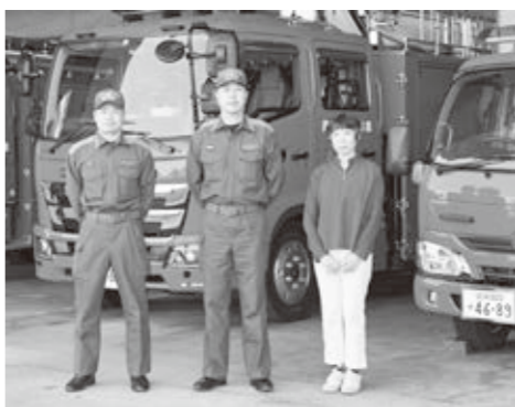
事業を実施するメンバー

▼事業者 たかしま災害支援ボランティアネットワーク「なまず」 ▼担当課 消防本部予防課 ▼事業目的 保育関係者と子どもたちに、火災や地震等の災害から生命を守るための行動を効果的に分かりやすく伝えます。