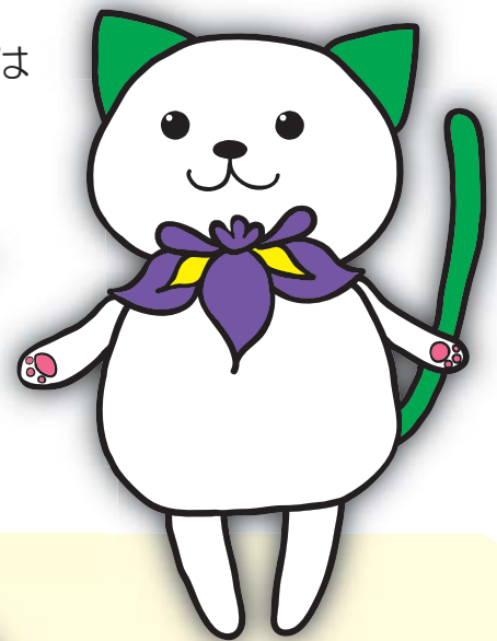
病院まつりキャラクター しまにゃん

ご来場いただいたみなさまの投票で 病院まつりキャラクターの 「しまにゃん」が誕生しました！ これからの活躍にご期待ください！