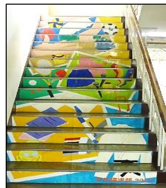
学校の活動を表現した階段アート【文化探求部】