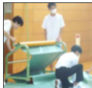
てきぱき活動する後始末