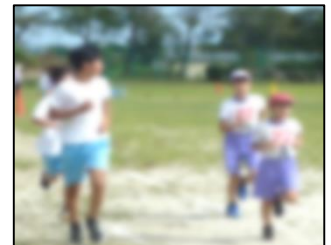
小6への陸上練習支援

陸上大会を控える小学校6年生に、陸上練習の支援をしました。ある小学校の先生が「小学校で練習していたときより、いい記録が出た」とおっしゃっておられました。