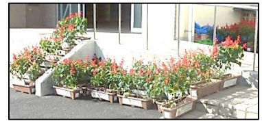
体育館前のサルビア

1学期、日赤奉仕団の方にお世話になり、3年生が植えた花が美しく咲きました。また、敬老の日には、3年生が、高齢の方へのメッセージを書きました。