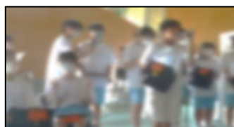
出演者を支えるプロンプター