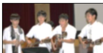
声援にこたえる歌声

この文化祭の取組を通して考えてほしかった「それぞれの役割を誠実に果たすことと、助け合うこと」、「一人ひとは、自分の人生の主人公であること」等を念頭におき、未来を切り拓く人に成長していくことを願っています。