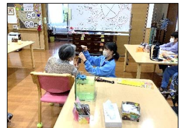
介護福祉体験より