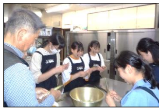
妙高民泊体験より