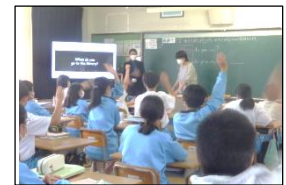
英語科の授業より

私が思う「生きる」ということは、楽しいことや悲しいこと、いろいろな体験をして成長する物語のようなものだと思います。「楽しいことがあれば、心という部屋にいる私がぴょんぴょんとする感覚、嬉しいことがあればふわふわした充実感、悲しいことがあれば空っぽになる寂しい感覚、なのに心が重くなる。しかし、こんなときに友達や家族、先生に相談するととても心が軽くなる。」