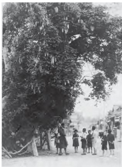
大正期撮影 満開の藤

【お詫びと訂正】 4月号に次の誤りがありました。お詫びのうえ訂正いたします。 「網齋書院100周年」3段目の西暦(誤)(1911) (正)(1910)