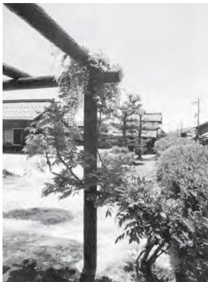
令和5年撮影 開花した藤

に補修された藤棚には、大正期に植えられた藤の木がツルや枝を広げ、毎年、長い房の花を咲かせています。昨年その藤棚