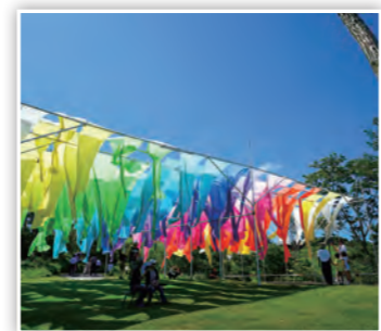
「虹色カーテン」 虹色の高島ちぢみの布が青空を漂っていて素敵だね！(しまK)