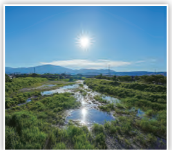
「太陽輝く！」 鴨川橋からの風景。河川にも太陽が映って、まるで太陽が2つあるみたい！(たかP)

スマートフォンや携帯電話などからの応募も大歓迎！また、市ホームページではカラーで掲載！