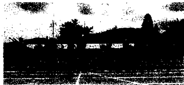
青組：キレイのあるダンスでみんなを盛り上げたて賞