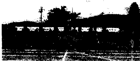
赤組：スマイルで友情を深め、心が熱く燃えたて賞