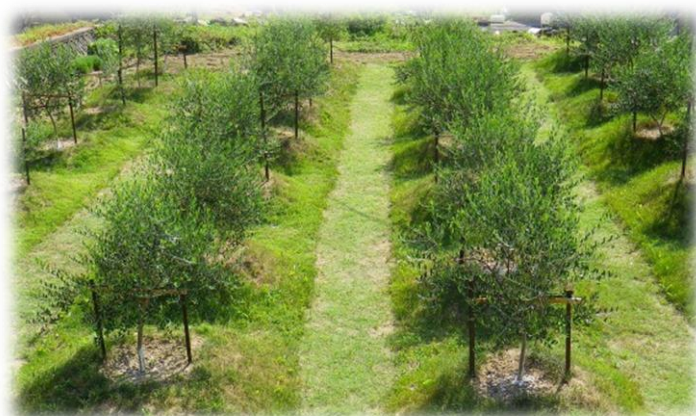
山田オリーブ園(小豆島)

モクセイ科オリーブ属に分類される常緑高木です。自家不和合性が高く、1600を超える品種が確認されています。非常に長寿な木としても知られており、世界には樹齢2000年を超えるものも少なくありません。それに加え、「平和」「知恵」「勝利」という花言葉を持つことから、シンボルツリーとしても人気があります。