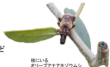
枝にいる オリーブアナアキゾウムシ