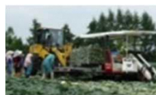
機械化体系の導入