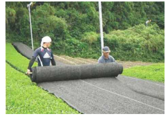
茶の被覆作業の実施