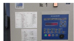
環境制御盤の導入