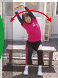
背伸び・体側伸ばし