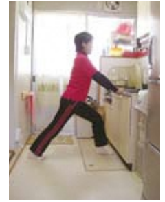
ふくらはぎ伸ばし