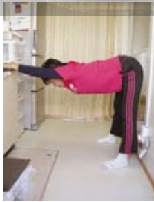
肩と太もも裏のばし