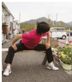
内ももと背中伸ばし