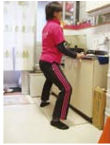
ハーフスクワット