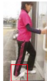
アキレス腱伸ばし