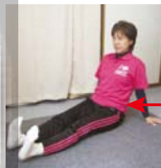
足首の曲げ伸ばし

じっとしていると足腰の血行が悪くなり、疲労や腰痛、むくみや冷えにつながります。意識して脚の血流改善を積極的に行いましょう!