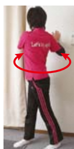
上体ひねり(左右・斜め上)