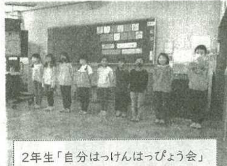
2年生「自分はっけんはっぴょう会」