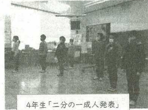
4年生「二分の一成人発表」