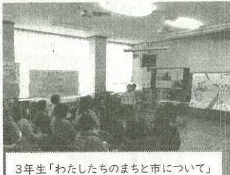
3年生「わたしたちのまちと市について」