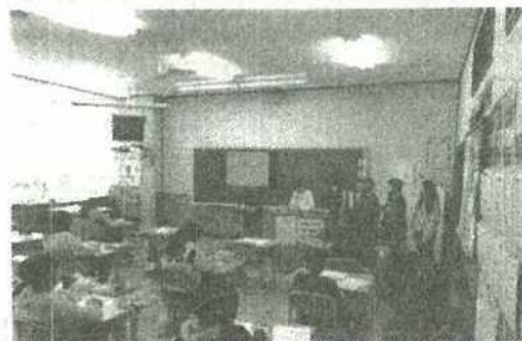
5年生「ベルマークとくらし」「琵琶湖と環境」