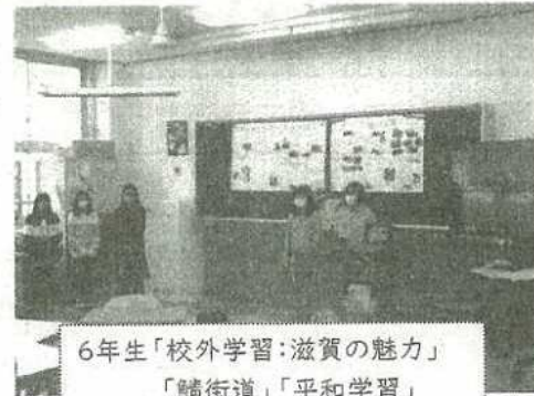
6年生「校外学習:滋賀の魅力」 「鯖街道」「平和学習」