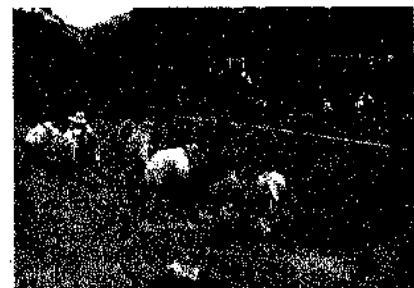
暑い中での作業 ありがとうございました