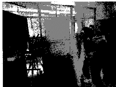
オンライン交流の練習