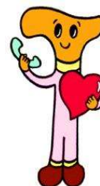
はなしてなごむ君