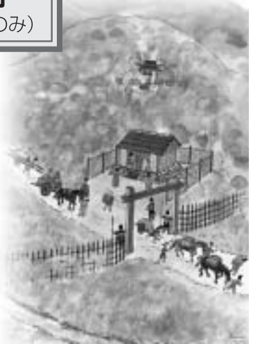
使用イラスト「大杉の関所想像図」